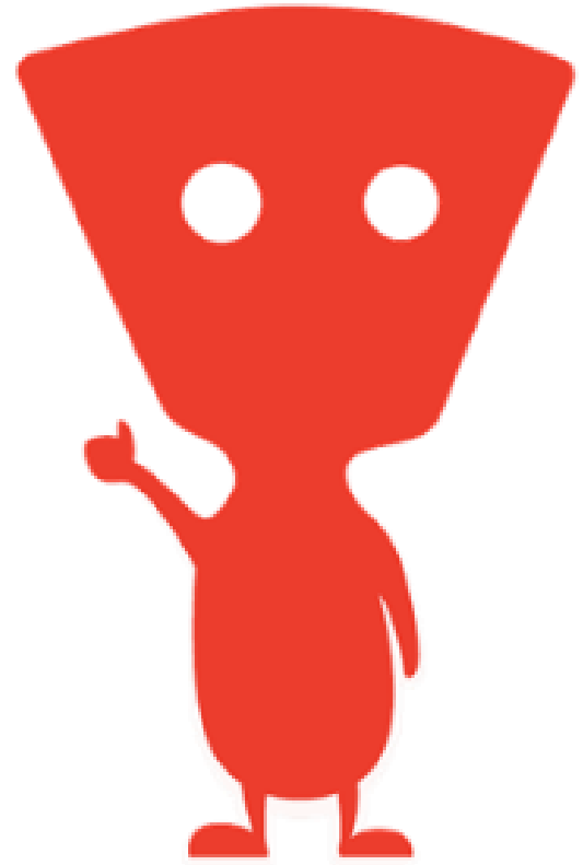
iO, mascotte du Dénicheur

leDénicheur, inspiré du site suédois Prisjakt, est lancé en France par le Groupe leboncoin. Créé en 2000, Prisjakt est aujourd'hui présent en Suède et en Norvège. Il existe également sous le nom PriceSpy au Royaume-Uni, en Irlande et en Nouvelle-Zélande mais aussi en tant que Hintaoapas en Finlande et PagoMeno en Italie.